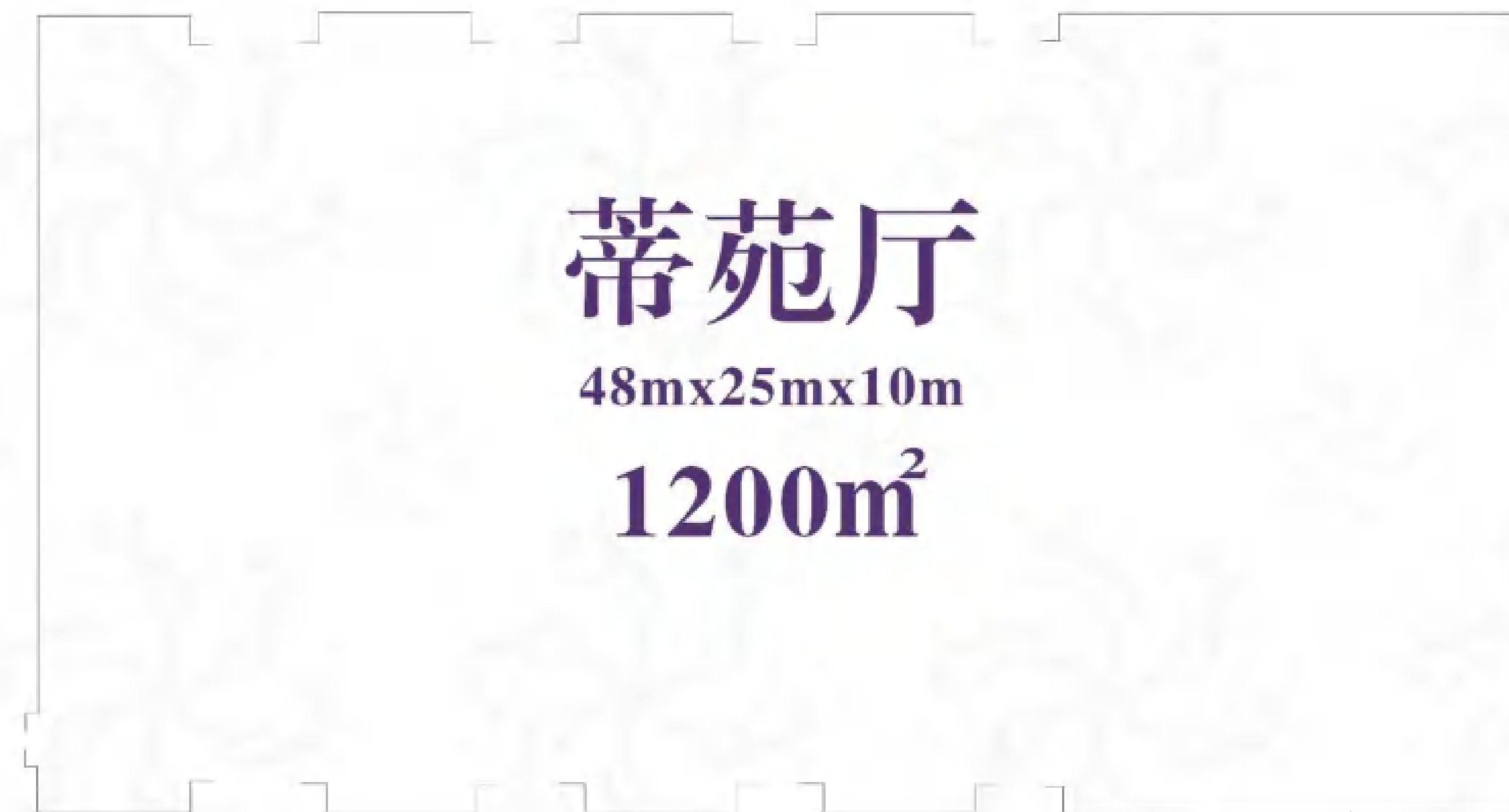
一层平面图 1F Floor Plan